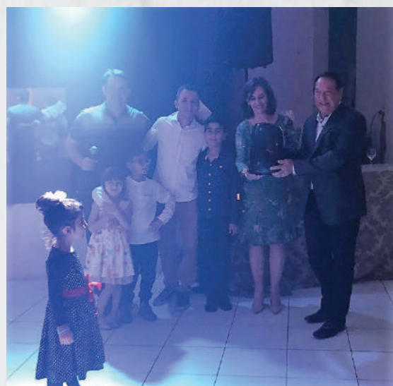
Marco Valenga - Fritadeira elétrica