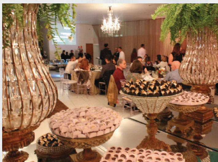
Mesa de doces