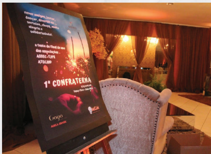
Entrada do evento